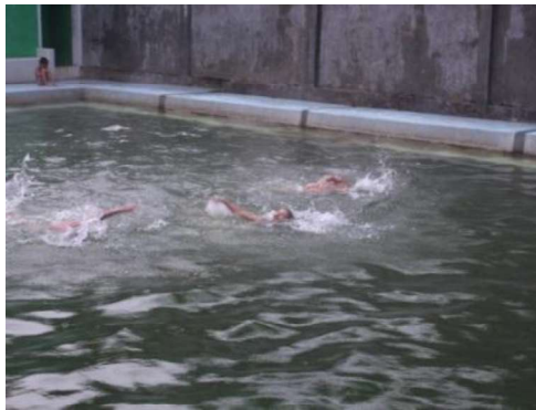
Gambar 2. Kolam Pemandian Aie Angek Garara