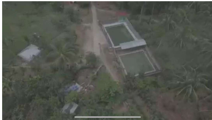
Gambar 1. Aie Angek Garara

indah dari danau yang berada dibawahnya. Daerah di Kabupaten Solok yang saat ini sedang dalam pengembangan wisata adalah Nagari Cupak dengan daya tarik wisata Pemandian Aie Angek Garara.