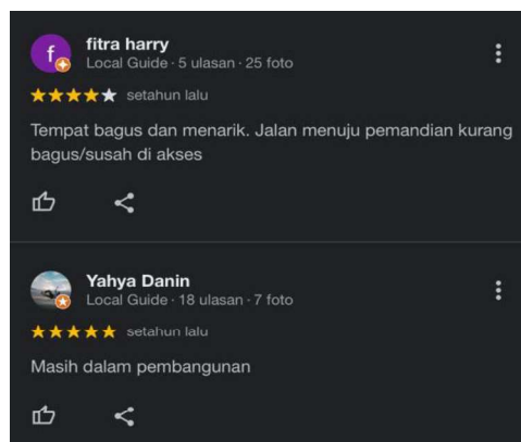
Gambar 3. Ulasan Pengunjung mengenai kondisi jalan Pemandian

Permasalahan pertama terkait attraction di Pemandian Aie Angek Garara yang masih terbatas bagi pengunjung hanya sekedar mandi air hangat saja. Belum ada atraksi lain untuk membuat pengunjung lebih berlama-lama di lingkungan pemandia Aie Angek Garara Nagari Cupak.