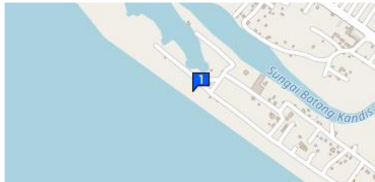
Gambar 1. Peta Lokasi Pantai Pasir Jambak.

Dengan potensi wisata yang dimiliki oleh pantai pasir jambak, namun masih kurangnya pengelolaan terutama upaya dalam mencitrakan daya Tarik wisata dan juga mempromosikan daya Tarik wisata pantai pasir jambak, sehingga tingkat kunjungan dapat terus meningkat, tidak hanya pada wisatawan domestik namun juga wisatawan asing, sehingga diperlukan pengelolaan manajemen yang baik, dan pada akhirnya memberikan kesejahteraan bagi masyarakat setempat dan juga cita-cita pemerintahan dalam hal wisata nasional.