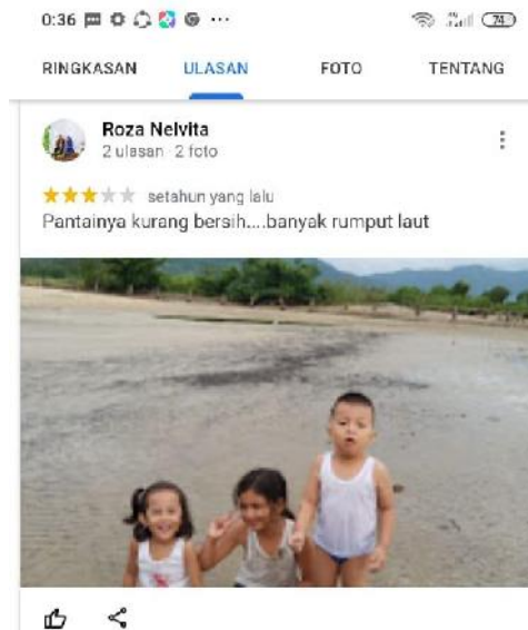
Gambar 4. Ulasan dari pengunjung