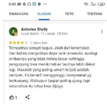
Gambar 3. Ulasan dari pengunjung