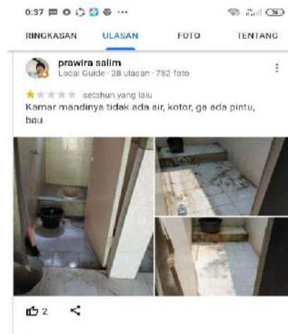
Gambar 2. Ulasan dari pengunjung

Selanjutnya penulis juga menayakan mengenai kebersihan pantai sako kepada pengunjung 60% menjawab kurang terawatnya pantai tersebut di karenakan kurang berfungsinya tempat sampah di area pantai.. Dapat dilihat pada gambar berikut :