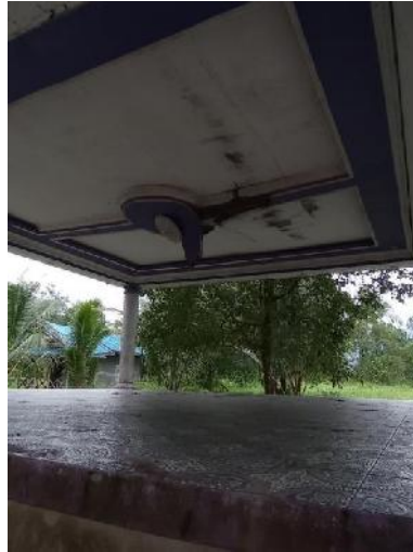
Gambar 7. Mushola

mengenai mushola, 10 pengunjung yang penulis temui 90% orang pengunjung menyatakan Mushola tidak berfungsi dengan baik seperti tidak tersedianya kain sarung, mukenah dan sajadah di daya tarik wisata Pantai Sako tersebut. Dapat di lihat dari gambar di bawah ini :