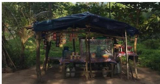
Gambar 6. Warung Penyedia Makan dan Minum Wisatawan Sumber: Pra Penelitian Penulis 24 Mei 2021

Masalah selanjutnya adalah penulis menanyakan kepada 10 orang pengunjung mengenai warung makan yang ada di Pantai Sako 50 % orang menyatakan kurang lengkapnya fasilitas penyedia kebutuhan makanan dan minuman wisatawan selama berkunjung ke pantai sako, hal ini dapat penulis lihat dari 2 warung penyedia makanan dan minuman sehingga belum maksimal untuk memenuhi kebutuhan wisatawan yang berkunjung ke daya tarik wisata Pantai Sako. Dapat terlihat pada gambar 6 dibawah ini.