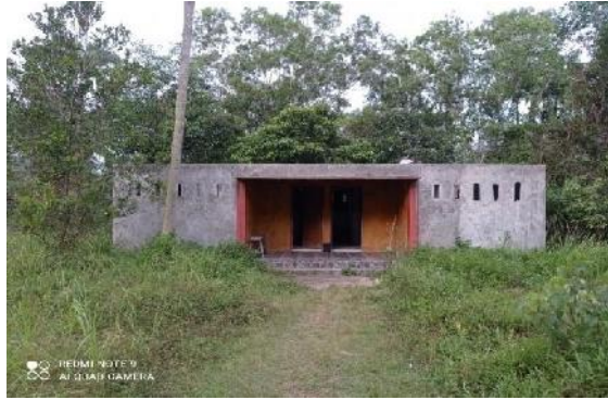
Gambar 1. Kamar Bilas dan Toilet Umum

terawatnya fasilitas toilet umum yang ada di daya tarik wisata Pantai Sako Padang tersebut . dapat dilihat pada gambar 1 berikut :