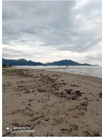
Gambar 5. Pantai Sako Sumber Pra Penelitian Penulis 24 Mei 2021

Masalah selanjutnya adalah penulis menanyakan kepada 10 orang pengunjung mengenai warung makan yang ada di Pantai Sako 50 % orang menyatakan kurang lengkapnya fasilitas penyedia kebutuhan makanan dan minuman wisatawan selama berkunjung ke pantai sako, hal ini dapat penulis lihat dari 2 warung penyedia makanan dan minuman sehingga belum maksimal untuk memenuhi kebutuhan wisatawan yang berkunjung ke daya tarik wisata Pantai Sako. Dapat terlihat pada gambar 6 dibawah ini.