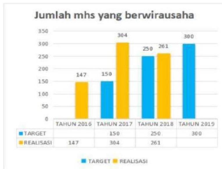
Gambar 1. Grafik Target Jumlah Mahasiswa yang berwirausaha di UNP

yang ditentukan oleh variabel tingkat teknologi, serapan teknologi, kualitas rata-rata institusi saintifik dan ketersediaan saintis dan teknokratnya.