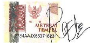
M A RAFLI NIM.17076103