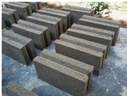
Gambar 1. Batako

Contoh penggunaan batako adalah pada bangunan konstruksi tingkat tinggi atau gedung, dimana batako dimanfaatkan untuk dinding pembatas dan estetika tanpa memikul beban yang ada di atasnya. Berikut merupakan bentuk dari batako: