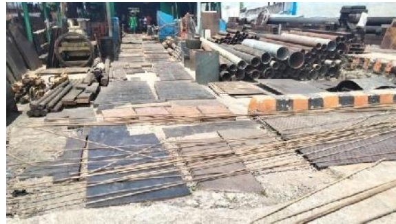
Gambar 1. To ko Besi Bekas