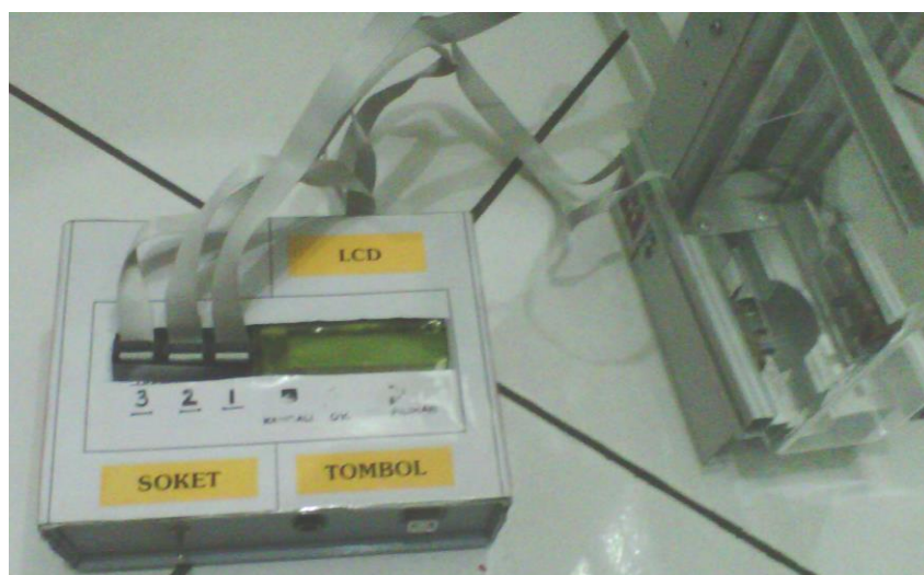
GAMBAR 3. Alat peraga momentum dengan sistem sensor.