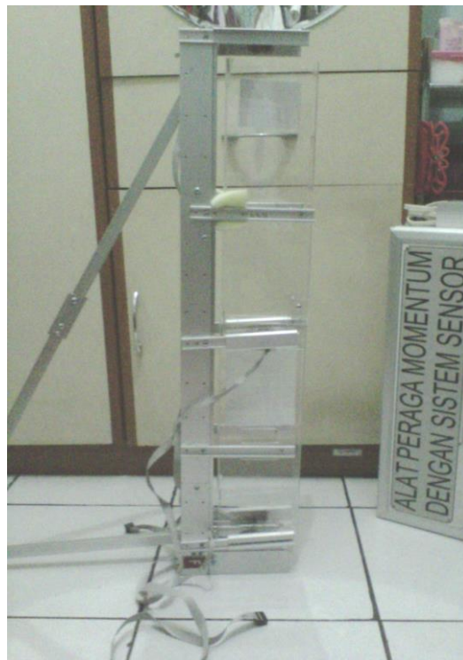
GAMBAR 2. Alat peraga momentum dengan sistem sensor.