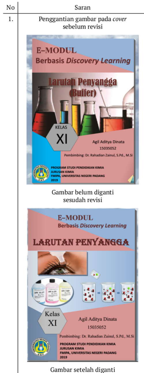
Tabel 2. Saran yang diberikan validator dan perbandingan cover E-Modul sebelum revisi dan sesudah revisi

Pada komponen kemudahan penggunaan, praktikalitas guru mempunyai momen kappa senilai 0,88 kategori sangat tinggi dan praktikalitas siswa mempunyai momen kappa 0,82 kategori sangat tinggi. Bahasa yang digunakan pada e-modul ini mudah dipahami, pertanyaan-pertanyaan yang