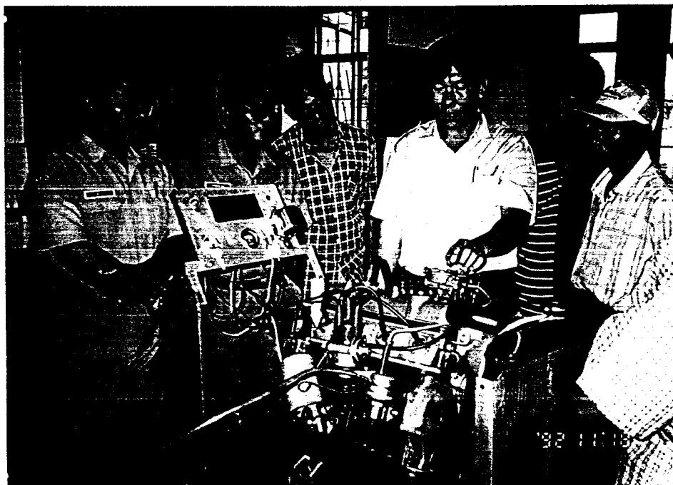
Praktek Pengenalan Komponen Mesin