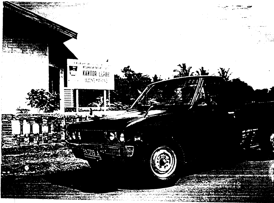
Praktek Mengemudi Tanpa Bimbingan