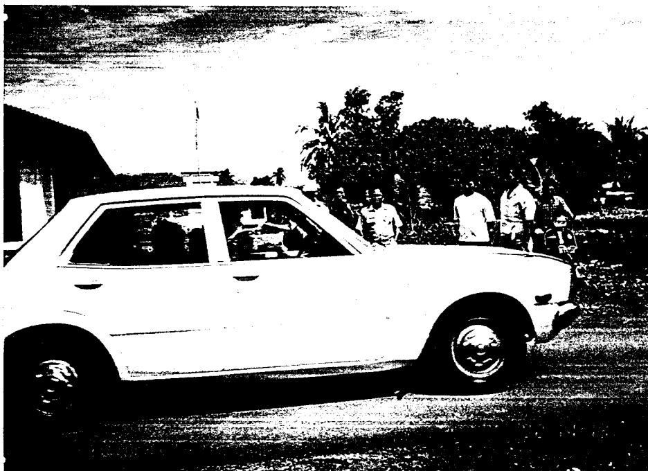
Praktek Mengemudikan Mobil Sedan