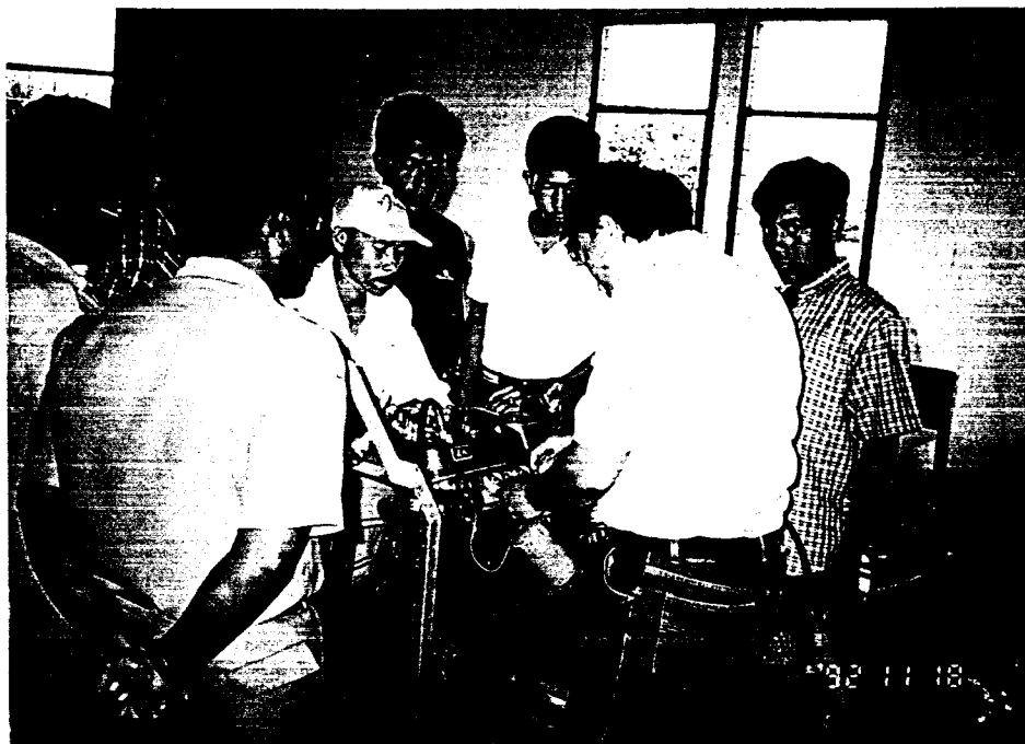
Praktek Penyetelan Pengapian dan Platina