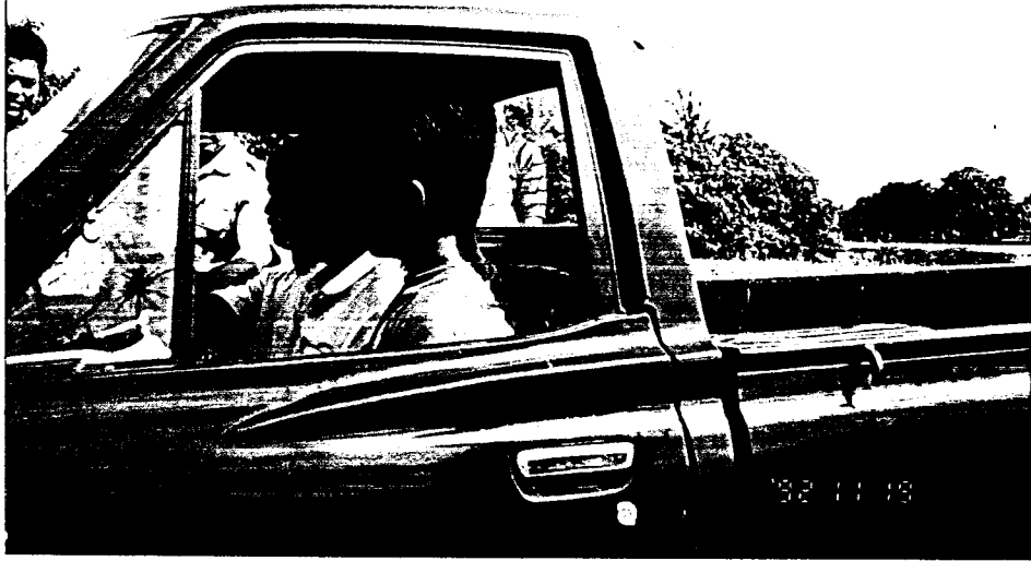
Praktek Mengemudi dengan Datsun