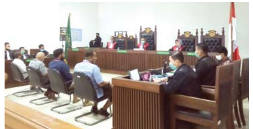
EMPAT saksi memberikan keterangan secara bergilir di Pengadilan Tipikor PN Padang, atas kasus dugaan penerimaan fee proyek yang menjerat Bupati nonaktif Solsel Muzni Zakaria, Rabu (5/8). WINDA

PADANG, HALUAN —Jaksa menghadirkan empat saksi lagi dalam sidang lanjutan dugaan penerimaan fee (suap) proyek yang menjerat Bupati nonaktif Solok Selatan (Solsel) Muzni Zakaria, Rabu (5/8). Salah seorang saksi menyebutkan pernah mendapat informasi bahwa terdakwa Muzni