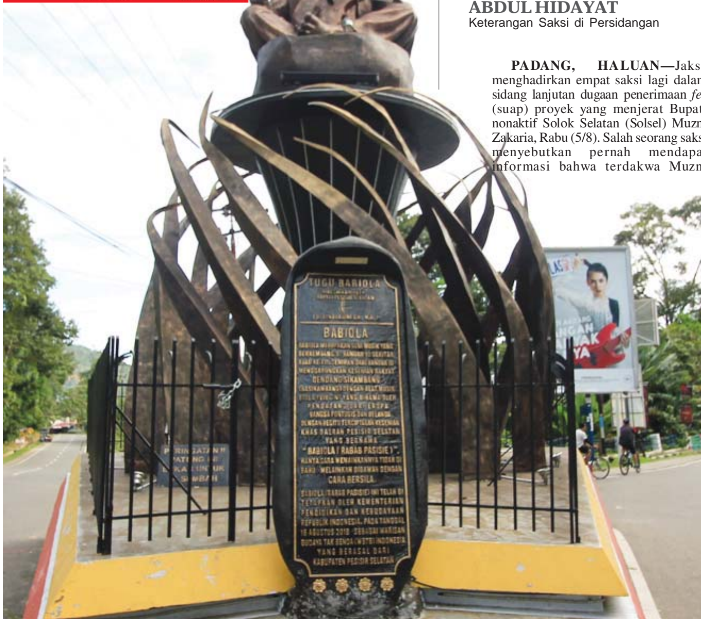
WARISAN TAK BENDA —Tugu Babiola Pasisia berdiri kokoh di Jalan Raya Painan, Pesisir Selatan, Rabu (5/8). Tugu ini ditetapkan oleh Kementerian Pendidikan dan Kebudayaan RI sebagai warisan budaya tak benda (WBTB) Indonesia dari Kabupaten Pessel pada 16 Agustus 2019.