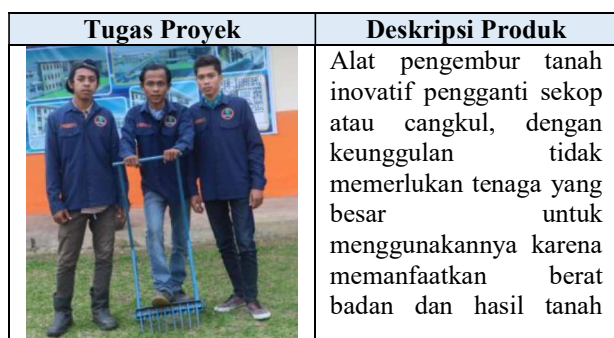
Tabel 1. Hasil Tugas Proyek Mahasiswa

Kegiatan pembelajaran yang terakhir adalah presentasi laporan tugas proyek yang dilaksanakan pada pertemuan ke-18. Kemampuan akhir yang diharapkan dari kegiatan pembelajaran ini adalah Mahasiswa mampu mengkomunikasikan dengan mempresentasikan laporan tugas proyek dalam bentuk seminar kelas. Hasil produk mahasiswa dapat dilihat pada tabel 1.