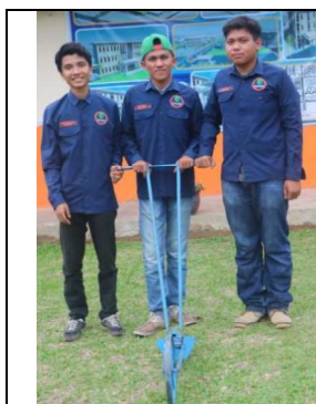
Kultivator Lister Manual

Kultivator lister manual adalah alat untuk kultivasi tanaman berjarak, dengan cara kerja didorong secara manual, kemudian piringan bajak yang dipasang mendorong tanah kearah tanaman.