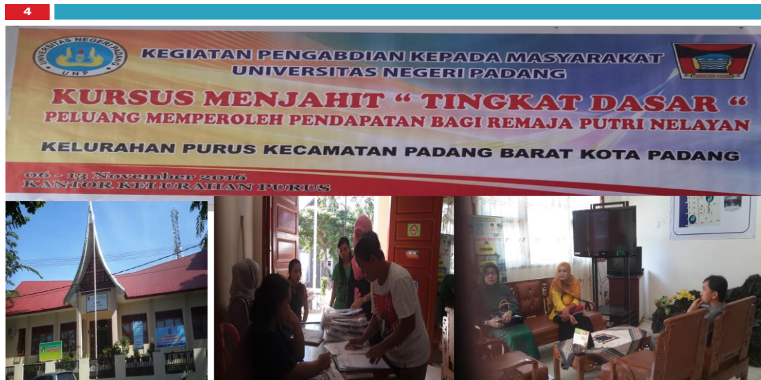
Sumber: Koleksi Pribadi Azmi Fitriasia, 2016

Pemasaran masih sangat terbatas. Anggota kelompok usaha menjajakan hasil produk ke kantor-kantor, digelar tikar di tempat keramaian dan sebagian pembeli ada yang datang ke rumah produksi. Pada tahun 2017 telah dapat memberikan penghasilan bagi anggota yang bersungguh-sungguh meskipun belum maksimal. Pada tahun 2018 mereka coba diberikan bimbingan dalam manajemen usaha. Mereka dituntun untuk membetulkan administrasi. Pemasukan dan pengeluaran diatur dengan baik. Namun sepertinya masih belum terpahami dengan sempurna. Sehingga tahun 2018 ibu-ibu yang tergabung dalam usaha dan menekuni usaha pada kelompok menjahit masih terbatas. Hal ini wajar karena modal terbatas. Perputaran modal agak lamban. Namun terus diupayakan dengan pemasaran online. Kesukarannya untuk mempersiapkan foto-foto produksi masih terbatas. Dengan sumberdaya yang ada diupayakan memasarkan produk bedcover .