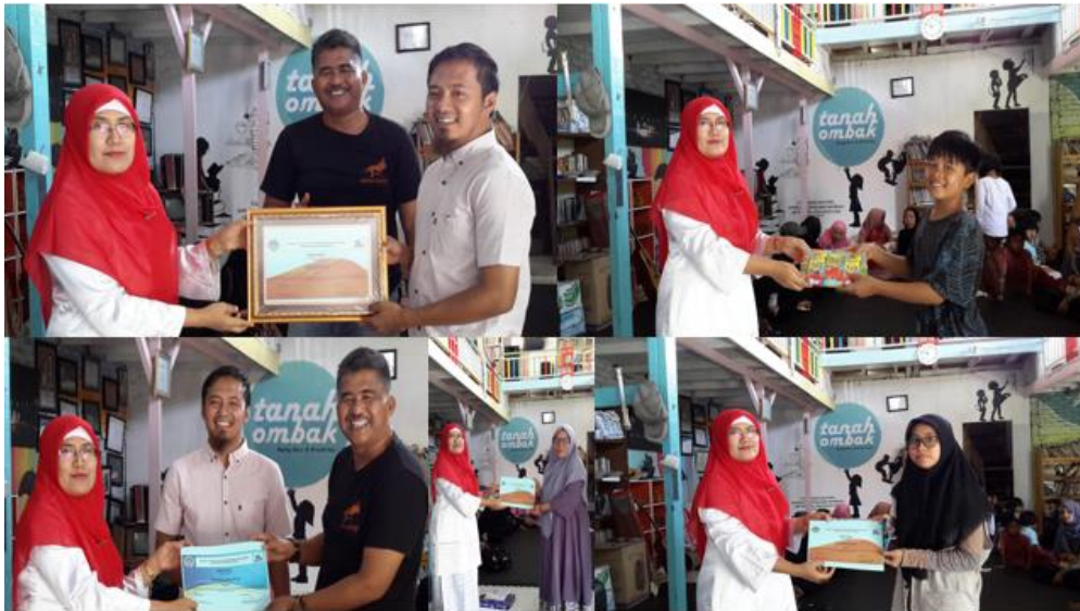
Gambar 6. Penyerahan sertifikat dan hadiah bagi Peserta