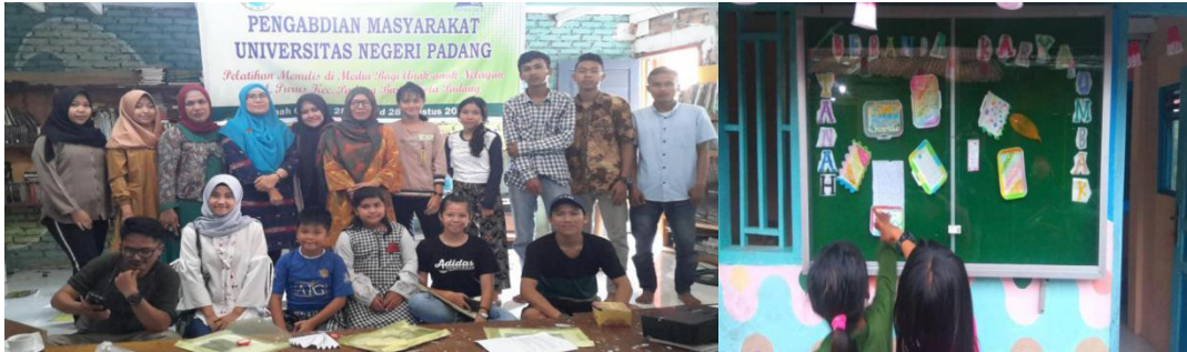
Gambar 5. Pelatihan Penulisan di Media Massa