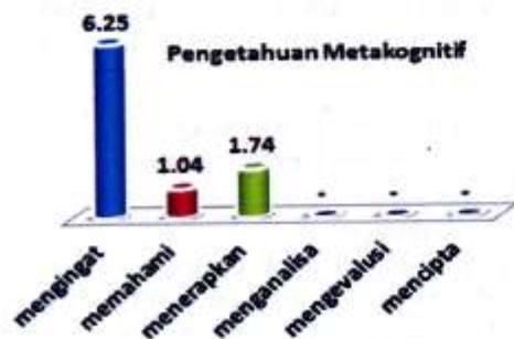
Gambar 4. Grafik Kecenderungan Persentase Pencapaian Pengetahuan Metakognitif Siswa

Kecenderungan persentase pencapaian kompetensi siswa untuk pengetahuan metakognitif ditinjau dari level-level proses kognitif disajikan oleh grafik pada Gambar 4.