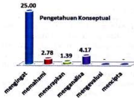
Gambar 2. Grafik Kecenderungan Persentase Pencapaian Pengetahuan Konseptual Siswa

Kecendrungan persentase pencapaian kompetensi siswa untuk pengetahuan konseptual ditinjau dari level-level proses kognitif disajikan oleh grafik pada Gambar 2.