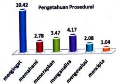
Gambar 3. Grafik Kecenderungan Persentase Pencapaian Pengetahuan Prosedural Siswa

Dari grafik pada Gambar 3, diperoleh informasi bahwa pencapaian kompetensi siswa untuk pengetahuan prosedural, mayoritas berada pada tingkatan proses kognitif level 1 (mengingat), yaitu 10,42 %, diiringi oleh level 4 (menganalisa), sebesar 4,17 %, selanjutnya level 3(menerapkan), sebesar 3,47 %, dan level 2 dan 5 ( memahami dan mengevaluasi), masing-masing sebesar 2,78 % dan 2,08 %, dan yang paling sedikit level 6 (mencipta), yaitu sebesar 1,04 %.