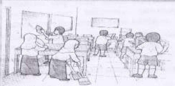
Gambar 4.5 Semua anggota kelas mengutamakan asas kekeluargaan.

Piket merupakan keputusan bersama yang harus dilaksanakan